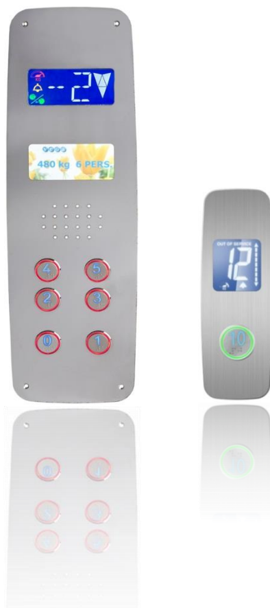
Italia soft 230 – Italia soft 95