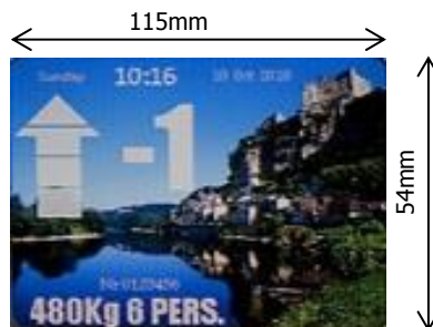
Exemple d'afficheur 5 » / Example of display 5 »