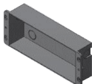
Boîte de fond / Background box