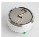
Bouton standard / Standard button