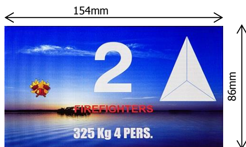
Exemple d'afficheur 7 » / Example of display 7 »