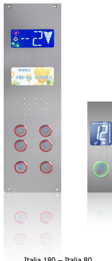
Italia 180 – Italia 80